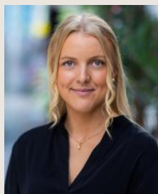
Pop-up uthyrning Isabel Tingelholm

Leasing Manager +46 8 562 532 39 anders.ohlsson@citycon.com